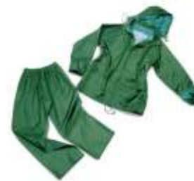
TRAJE AGUA NYLON