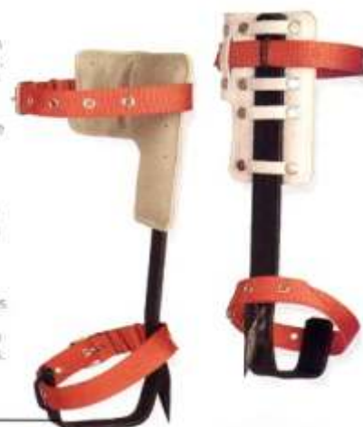
◆ Referencia T 20

● Trepolines con un solo pincho soldado, fabricado en platina curvada de acero al carbono. Provistos de cuatro correas de sujeción de 65 cm de longitud y almohadillas de cuero acolchadas. Correas de poliéster con hebillas y gajos metálicos. Pensado para trabajos en postes de madera, montajes eléctricos y telefónicos, poda de todo tipo de árboles, etc.