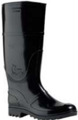
AGUA CAÑA ALTA