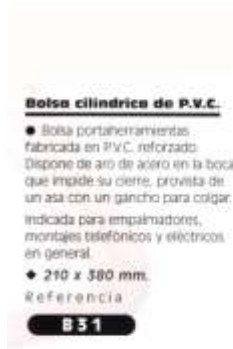
Bolsa cilíndrica de P.V.C. ● Bolsa portaherramientas fabricada en P.V.C. reforzado. Dispone de aro de acero en la boca que impide su cierre, provista de un asa con un gancho para colgar, indicada para empalmadores, montajes telefónicos y eléctricos, en general. ◆ 210 x 380 mm. Referencia B 31