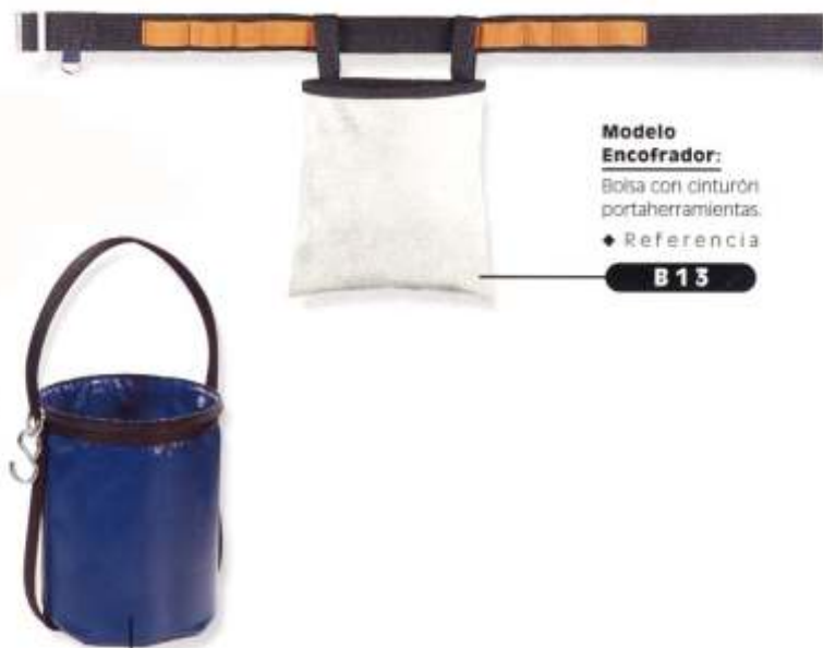
Modelo Encofrador: Bolsa con cinturón portaherramientas. ◆ Referencia B 13