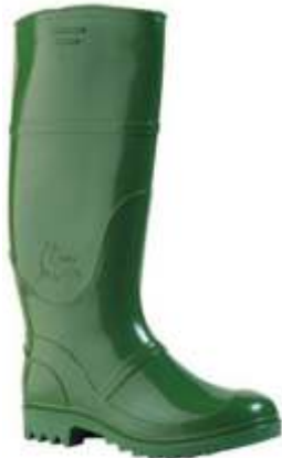
AGUA PUNTERA Y PLANTILLA