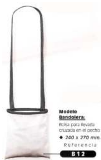
Modelo Bandolera: Bolsa para llevarla cruzada en el pecho. ◆ 240 x 270 mm. Referencia B 12