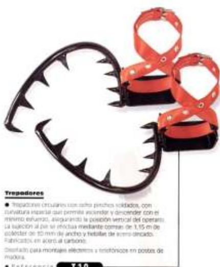
Trepadores ● Trepadores circulares con ocho pinchos soldados, con sujeción esencial que permita ascender y descender con el mínimo esfuerzo, asegurando la posición vertical del operario. La sujeción al pie se realiza mediante correas de 1,15 m de anchura de 10 mm de ancho y hebillas de acero anclado. Fabricados en acero al carbono. Diseñado para montajes eléctricos y telefónicos en postes de madera. ◆ Referencia T 10