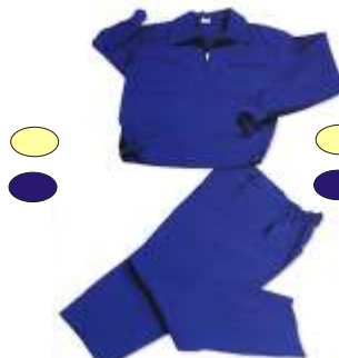
PANTALON , CHAQUETA Y CAMISA